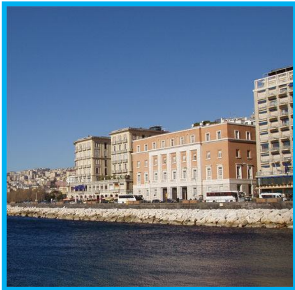
Centro congressi Federico II

I principali temi del Convegno sono: le tecnologie per il monitoraggio della sede ferroviaria, i sistemi diagnostici di bordo dei carri ferroviari e le tecniche di manutenzione delle infrastrutture e del materiale rotabile, il segnalamento ed il controllo della circolazione ferroviaria.